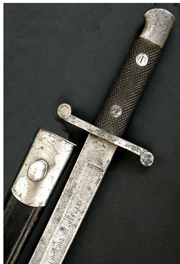
MACHETE modelo 1881 Libro ESPADAS ESPAÑOLAS, por Vicente Toledo