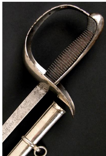
SABLE Oficial de Infantería, modelo 1887 Libro ESPADAS ESPAÑOLAS, por Vicente Toledo