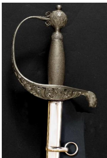
SABLE Caballeros y Escuderos de Cuenca Libro ESPADAS ESPAÑOLAS, por Vicente Toledo