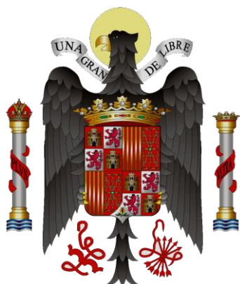
Escudo de España

Lleva un sable modelo 1943 para jefes y oficiales. Guarnición de cazoleta dorada y calada con el escudo del Ejército, y pomo con cabeza de león. El puño compuesto de dos cachas de madera cuadrillada sujetas por dos pasadores. Hoja recta y la vaina de acero con una anilla.