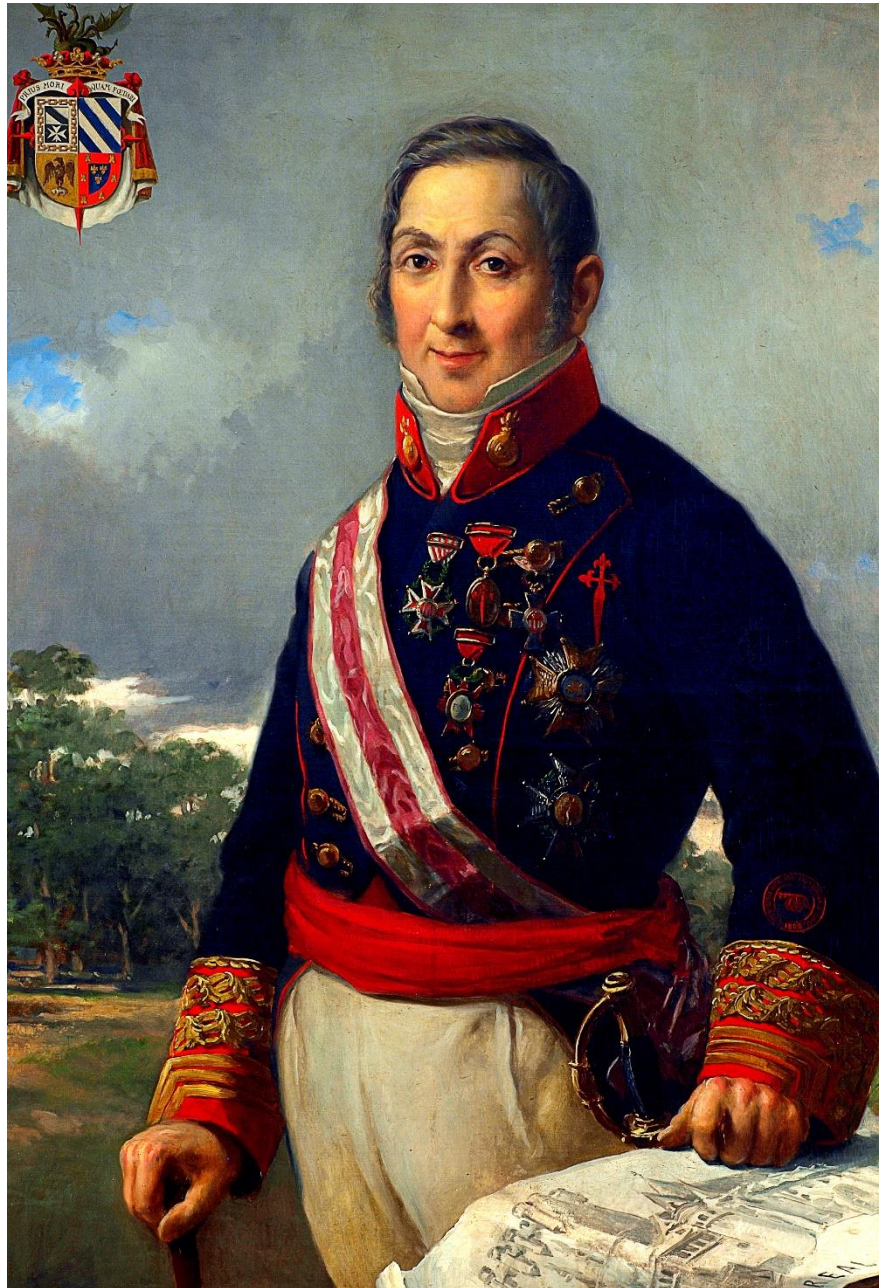
Óleo Colección de la Academia de Artillería de Segovia