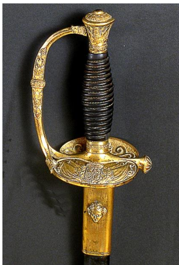
ESPADA DE CEÑIR Oficial General hacia 1816 Libro ESPADAS ESPAÑOLAS, MILITARES Y CIVILES. Pág. 136