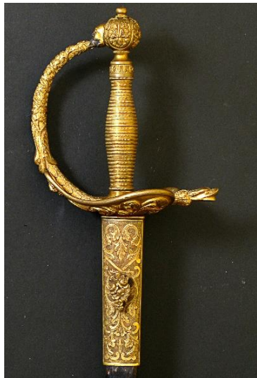
ESPADA DE CEÑIR Oficial General, modelo 1870 Libro ESPADAS ESPAÑOLAS, MILITARES Y CIVILES. Pág. 184