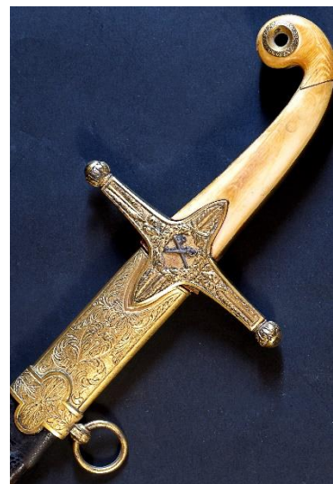
SABLE Para General modelo 1840 Libro ESPADAS ESPAÑOLAS, MILITARES Y CIVILES. Pág. 292