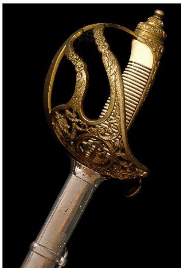
SABLE Caballero de la Orden de Santiago hacia 1870 Libro ESPADAS ESPAÑOLAS, por Vicente Toledo