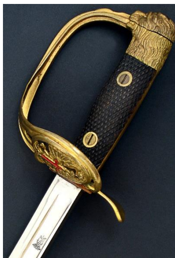
SABLE Jefes y oficiales modelo 1943 Libro ESPADAS ESPAÑOLAS, MILITARES Y CIVILES. Pág. 246