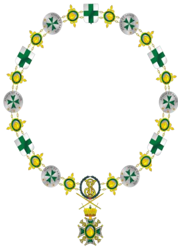
Gran collar Orden de San Lázaro

Espada a capricho, muy similar a la de la fotografía inferior. Guarnición de latón dorado con guardamano y cazoleta vuelta. Hoja recta, vaina de cuero con tres aparejos de latón dorado también y dos anillas.