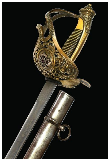
SABLE Caballero de la Orden de Calatrava hacia 1870 Libro ESPADAS ESPAÑOLAS, por Vicente Toledo