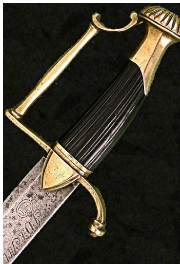
SABLE Principios siglo XIX Libro ESPADAS ESPAÑOLAS. MILITARES Y CIVILES. Pág. 524