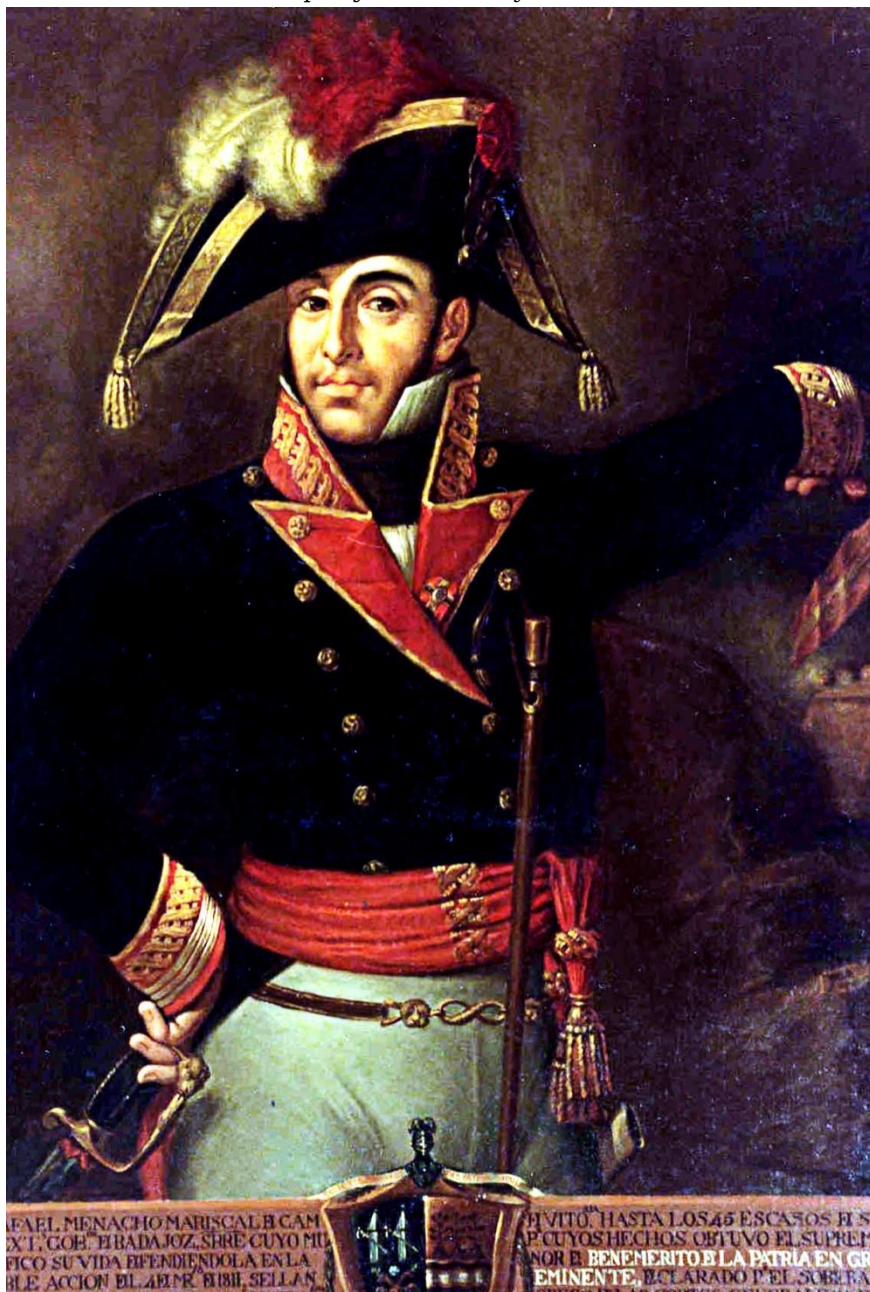
Óleo de la colección del Museo del Ejército