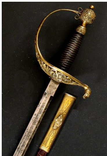
ESPADA DE CEÑIR Cuerpo Ingenieros de Minas Libro ESPADAS ESPAÑOLAS, por Vicente Toledo

de Ingenieros de Minas de 1886. Libro "Uniformes y emblemas de la Ingeniería Civil Española"