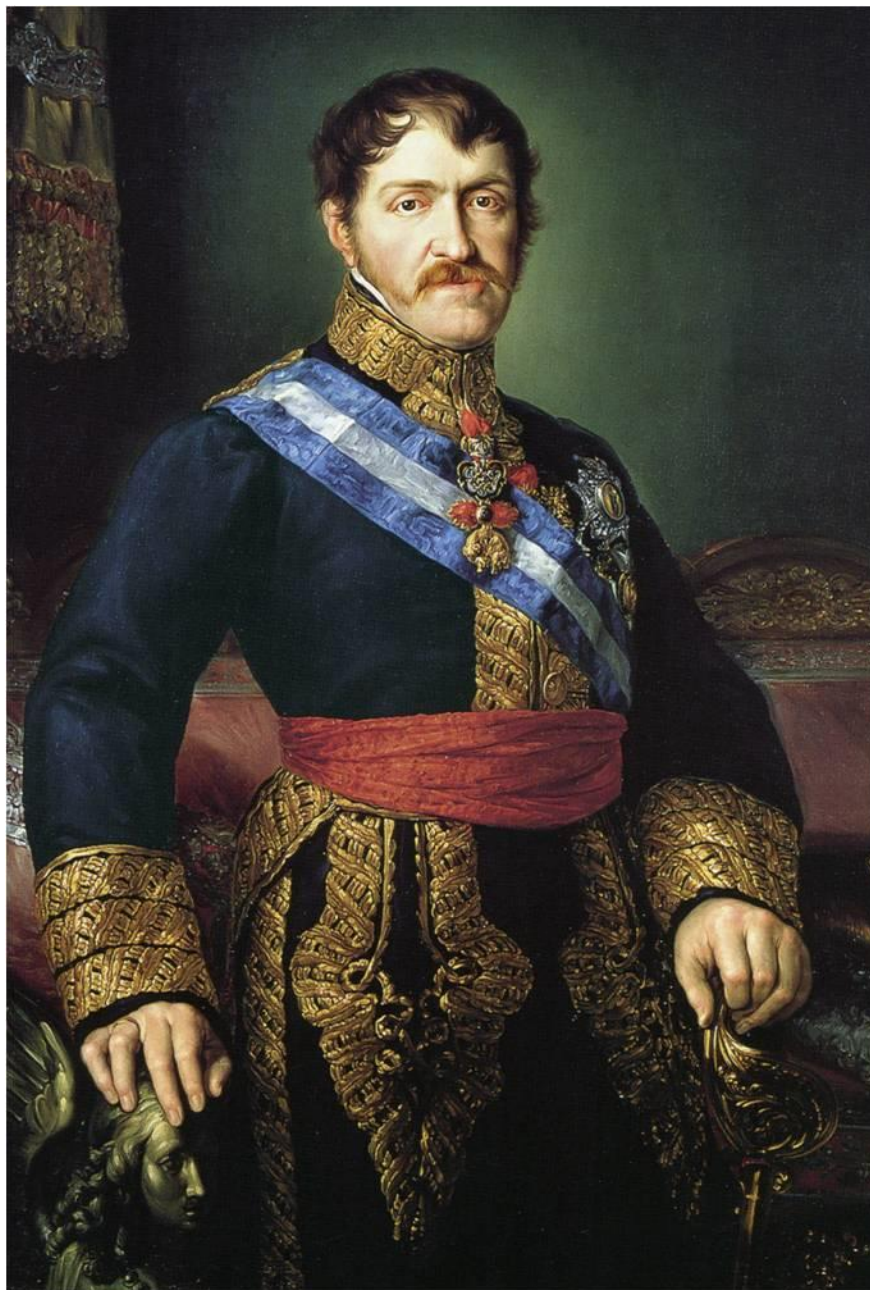
"Retrato de D. Carlos María Isidro de Borbón" Óleo pintado por Vicente López.