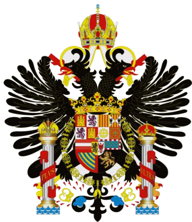
Armas de Carlos I de España y V de Alemania

Se aprecia una espada de las llamadas de lazo, muy de su época. Guarnición de hierro con puño alambrado, gran pomo, recazo, guardamano y varios gavilanes protectores. Hoja recta y larga.