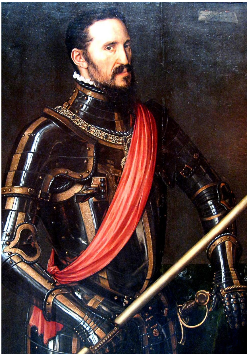
“Fernando Álvarez de Toledo, Duque de Alba” pintado por Antonio Mor en 1549. Se encuentra en The Hispanic Society of America.