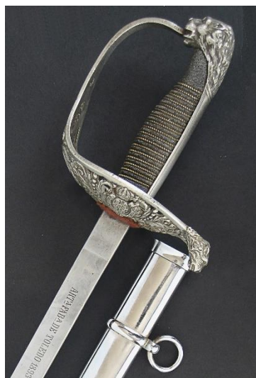
SABLE Oficial Intervención Militar modelo 1911 Libro ESPADAS ESPAÑOLAS, MILITARES Y CIVILES. Pág. 360