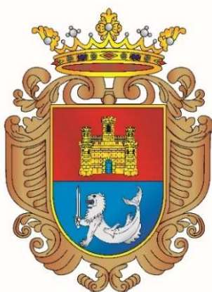
Escudo de la ciudad de Manila

Llevan una espada similar a la de sus homólogos peninsulares y característica de la Infantería de la época. Guarnición de barquilla de acero, con gavilanes rectos y puño alambrado. Hoja recta y vaina de cuero con aparejos metálicos.