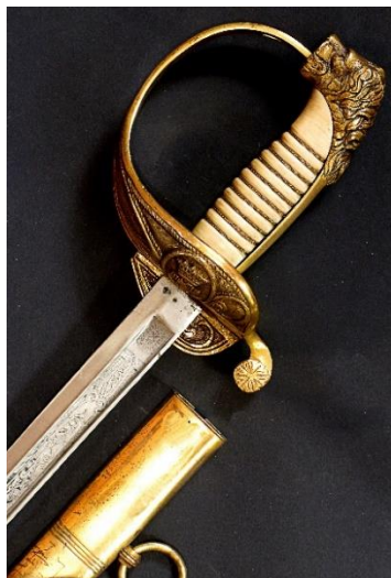
ESPADA-SABLE Jefes y oficiales de la Armada modelo 1844-57 variante con hoja recta P.S. Libro ESPADAS ESPAÑOLAS, por Vicente Toledo