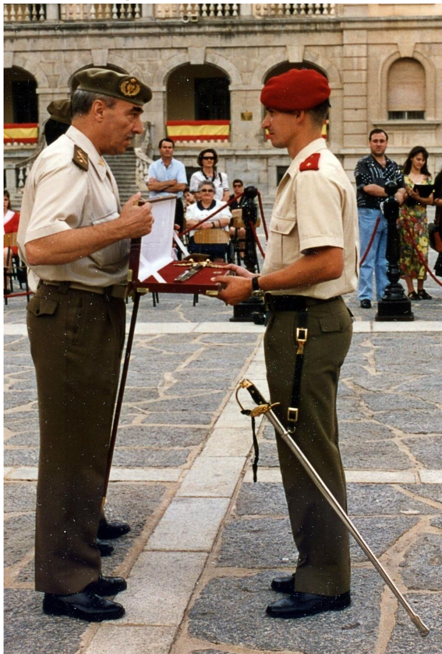
Fotografía de la Academia de Infantería de Toledo