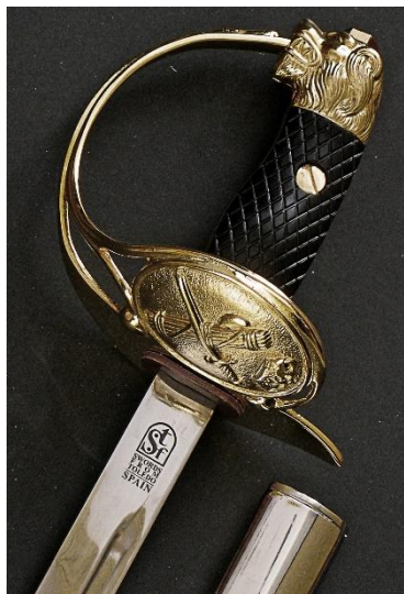
SABLE para oficial de la Guardia Civil, modelo 1943. Libro ESPADAS ESPAÑOLAS, MILITARES Y CIVILES.