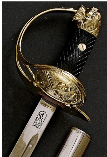
SABLE para oficial de la Guardia Civil, modelo 1943. Libro ESPADAS ESPAÑOLAS, por Vicente Toledo