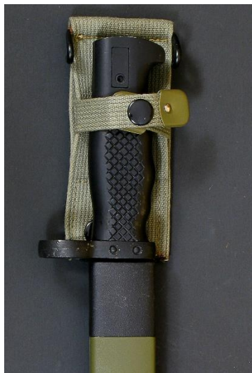
CUCHILLO-BAYONETA Para CETME, modelo C-1969 Libro ESPADAS ESPAÑOLAS, por Vicente Toledo