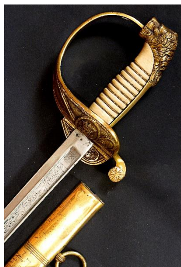
SABLE Jefes y oficiales de la Armada Española modelo 1844-57 hacia 1912 Libro ESPADAS ESPAÑOLAS, por Vicente Toledo