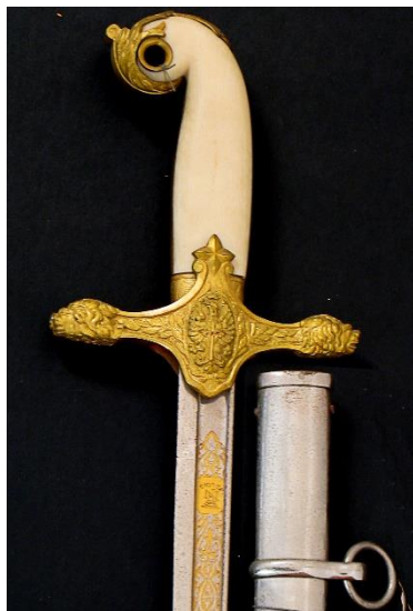
SABLE para General modelo 1943 Libro ESPADAS ESPAÑOLAS, por Vicente Toledo