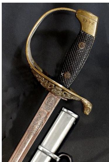
SABLE Personal del Cuerpo Auxiliar de Oficinas Militares Libro ESPADAS ESPAÑOLAS, por Vicente Toledo