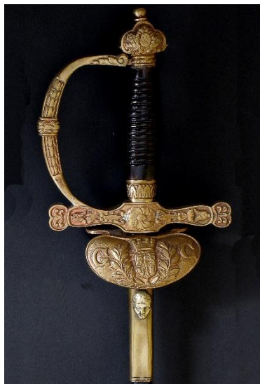
ESPADA DE CEÑIR Jefes y oficiales de la Guardia Civil, modelo 1844 Libro ESPADAS ESPAÑOLAS, por Vicente Toledo