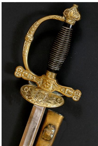
ESPADA DE CEÑIR Jefes y oficiales de la Guardia Civil, modelo 1844 Libro ESPADAS ESPAÑOLAS, por Vicente Toledo