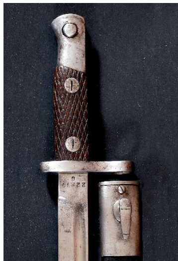
MACHETE-BAYONETA modelo 1913 Libro ESPADAS ESPAÑOLAS, por Vicente Toledo