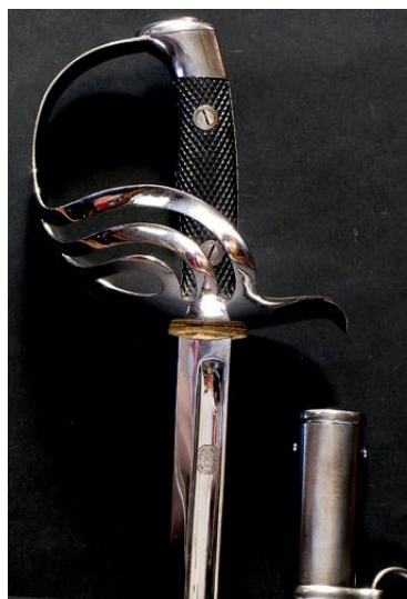
ESPADA DE MONTAR Oficial Escuadrón Escolta Presidencial modelo 1910 hacia 1931 Libro ESPADAS ESPAÑOLAS, por Vicente Toledo