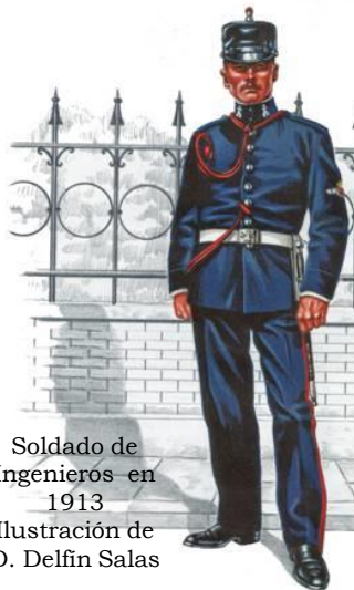
Soldado de Ingenieros en 1913 Ilustración de D. Delfin Salas

En el tahalí lleva un machete-bayoneta modelo 1913. De acero con pestillo y botón para anclar en el fusil, puño de madera cuadrillada sujeto por dos pasadores. Hoja recta y vaina de cuero negro con aparejos metálicos.