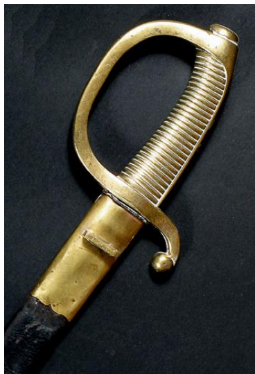
SABLE Sargentos a pie, modelo 1879 Libro ESPADAS ESPAÑOLAS, por Vicente Toledo