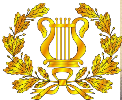
Emblema cuello Para Músicos

Puede llevar un espadín de tipo genérico, es decir, para ningún Arma o Cuerpo específico o un espadín para Músicos Mayores de principios del siglo XX en el que figura en el centro de los gavilanes una lira, su guarnición es de latón dorado con puño de ébano. Hoja recta y vaina de cuero con contera y brocal de metal.