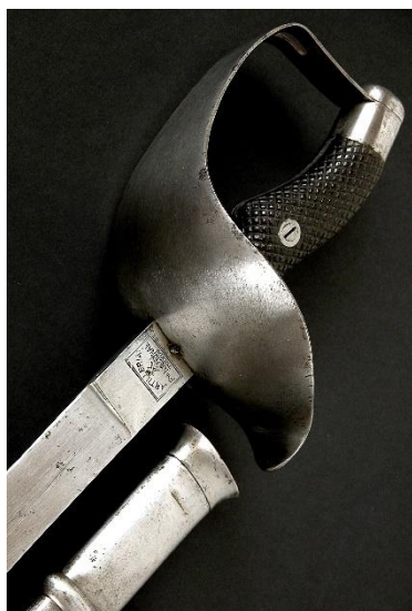
SABLE Tropas de Institutos Montados modelo 1895 Libro ESPADAS ESPAÑOLAS, por Vicente Toledo