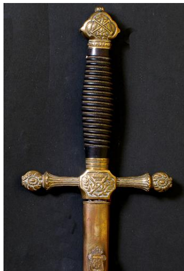
ESPADÍN Oficial de Infantería modelo 1901 Libro ESPADAS ESPAÑOLAS, por Vicente Toledo