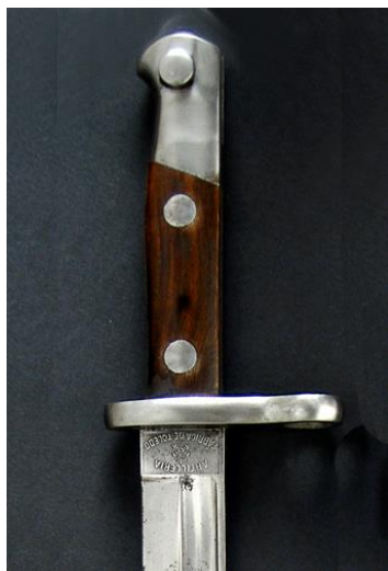
CUCHILLO-BAYONETA modelo 1893 Libro ESPADAS ESPAÑOLAS, por Vicente Toledo