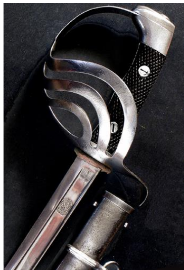
ESPADA DE MONTAR Jefes y oficiales del Escuadrón de la Escolta Real modelo 1910 Libro ESPADAS ESPAÑOLAS, por Vicente Toledo