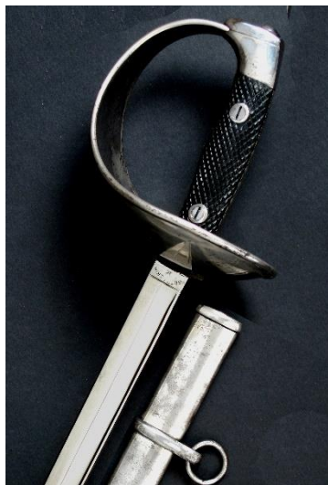
ESPADA-SABLE P.S. Para oficial de Caballería modelo 1908 Libro ESPADAS ESPAÑOLAS, por Vicente Toledo