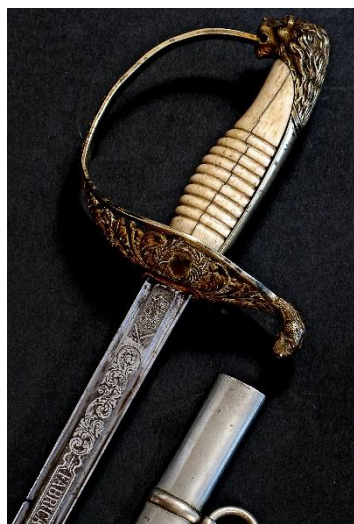
SABLE para oficial, modelo 1886 Libro ESPADAS ESPAÑOLAS, por Vicente Toledo