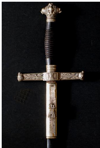
ESPADÍN Jefes y oficiales del Cuerpo de Ingenieros Libro ESPADAS ESPAÑOLAS, por Vicente Toledo