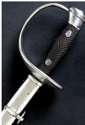
ESPADA-SABLE P.S. Jefes y oficiales de Infantería modelo 1909 Libro ESPADAS ESPAÑOLAS, por Vicente Toledo