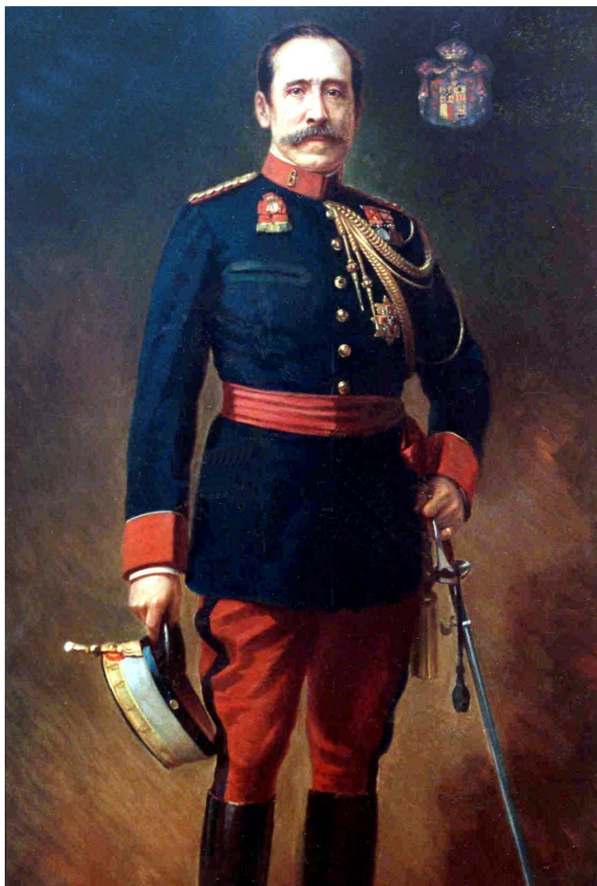
Óleo pintado por Morelli en 1913 (Museo del Ejército)