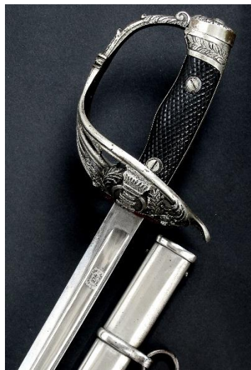
SABLE Oficial de Ingenieros Modelo 1860 variante 1926 Libro ESPADAS ESPAÑOLAS, por Vicente Toledo