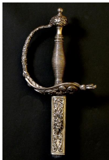
ESPADA DE CEÑIR para Brigadier modelo 1870 Libro ESPADAS ESPAÑOLAS, por Vicente Toledo