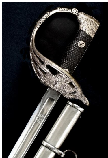
SABLE. Oficial de Ingenieros Modelo 1860 hacia 1926 Libro ESPADAS ESPAÑOLAS, por Vicente Toledo