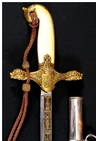
SABLE Oficial General, modelo 1908 Libro ESPADAS ESPAÑOLAS, por Vicente Toledo