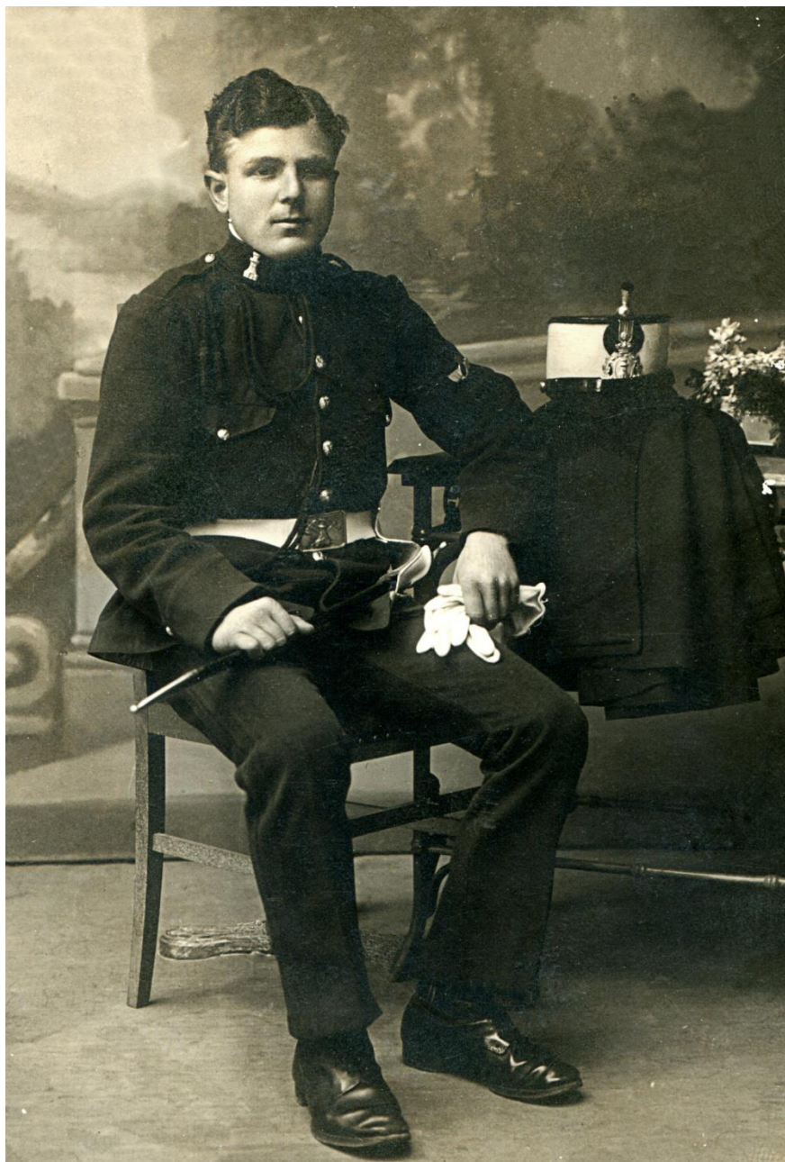
Fecha fotografía "Cuatro Vientos16-4-1917 Madrid"