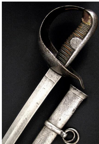
SABLE Para tropa de Caballería modelo 1860 reformado en 1888 Libro ESPADAS ESPAÑOLAS, por Vicente Toledo