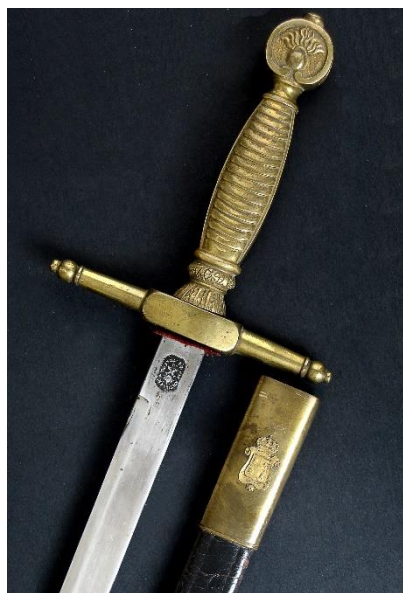
MACHETE Músicos Militares modelo 1879 Libro ESPADAS ESPAÑOLAS , por Vicente Toledo