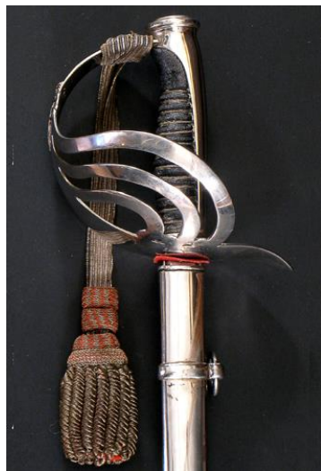
ESPADA DE MONTAR para oficial del Escuadrón de la Escolta Real, modelo 1875 Libro ESPADAS ESPAÑOLAS, por Vicente Toledo