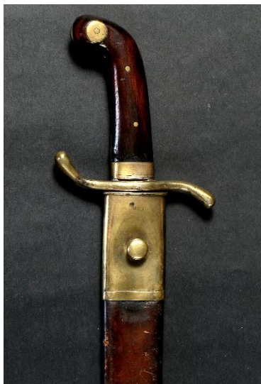
MACHETE Guardia Civil en Cuba, hacia 1860 Libro ESPADAS ESPAÑOLAS, por Vicente Toledo