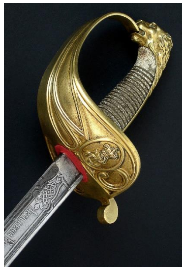
SABLE Jefes y oficiales de la Armada, modelo 1844-57 Libro ESPADAS ESPAÑOLAS, por Vicente Toledo